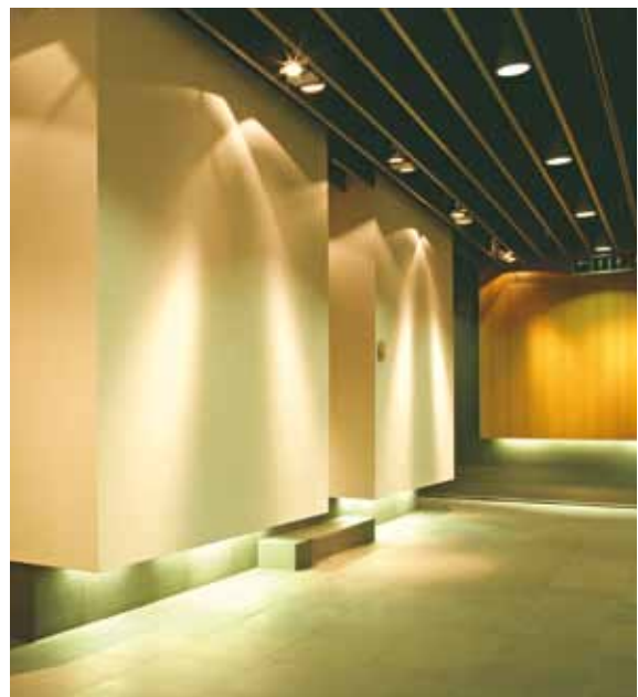
Lufthansa First Class Lounge, Frankfurt Design: Hollin + Radoske Architects