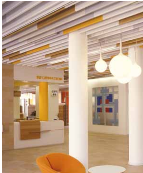
Volksbank Raiffeisenbank, Dachau Architekt: Architekturbüro Lewald

Unser umfangreiches Know-how, die jahrzehntelange Erfahrung und die persönliche Betreuung während des ganzen Projektverlaufes ermöglicht die Realisierung Ihrer Projekte auch mit individuellen Sonderlösungen – ganz, wie Sie es sich vorstellen.