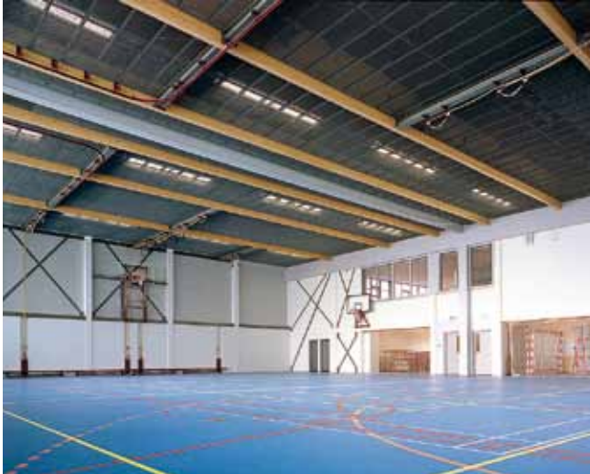
De @rchipel Bredeschool, Almere, Niederlande

Kombinieren Sie Zweckmäßigkeit und Gestaltung auf eine ansprechende Art und Weise: Schaffen Sie durch die verschiedenen Oberflächenstrukturen mit unseren Streckmetalldecken eine außergewöhnliche Stimmung. Ob Rauten- oder Quadratmaschen, als offenes oder geschlossenes System, unsere große Bandbreite an Maschenvarianten ermöglicht Ihren Räumen einen individuellen Auftritt.