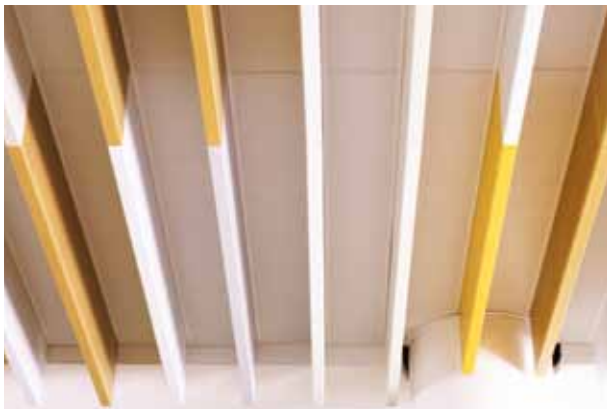
Volksbank Raiffeisenbank, Dachau Architekt: Architekturbüro Lewald

Sie stellen sich einfach eine Decke nach Ihren Vorstellungen zusammen und wir liefern Ihnen die Komplettlösung aus einer Hand. Zusammen mit Lindner Leuchten und weiteren Einbauelementen bieten wir Ihnen ein perfekt aufeinander abgestimmtes Produkt. Alle Systeme erhalten Sie in unterschiedlichen Perforationen und Dekoren. Neben Standardoberflächen realisieren wir auch individuelle Wunsch-Oberflächen und -Farbtöne. Wo auch immer Sie Ihre Decke montieren lassen möchten, unsere Beschichtungen sind sowohl für den Innen- und Außenbereich als auch für Brandschutz- und Kühldecken bestens geeignet. Ganz nach Ihren Vorstellungen.