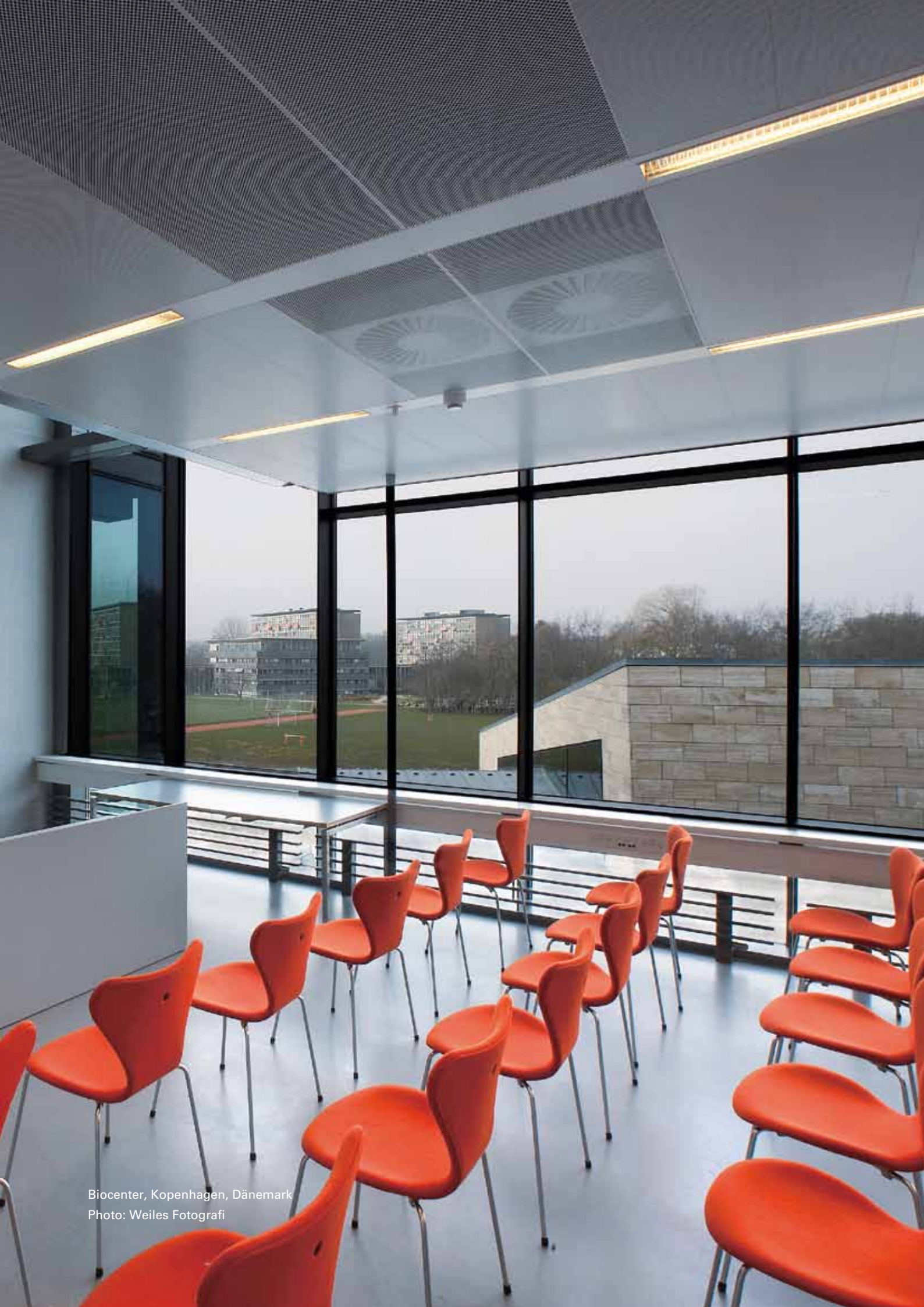
Biocenter, Kopenhagen, Dänemark