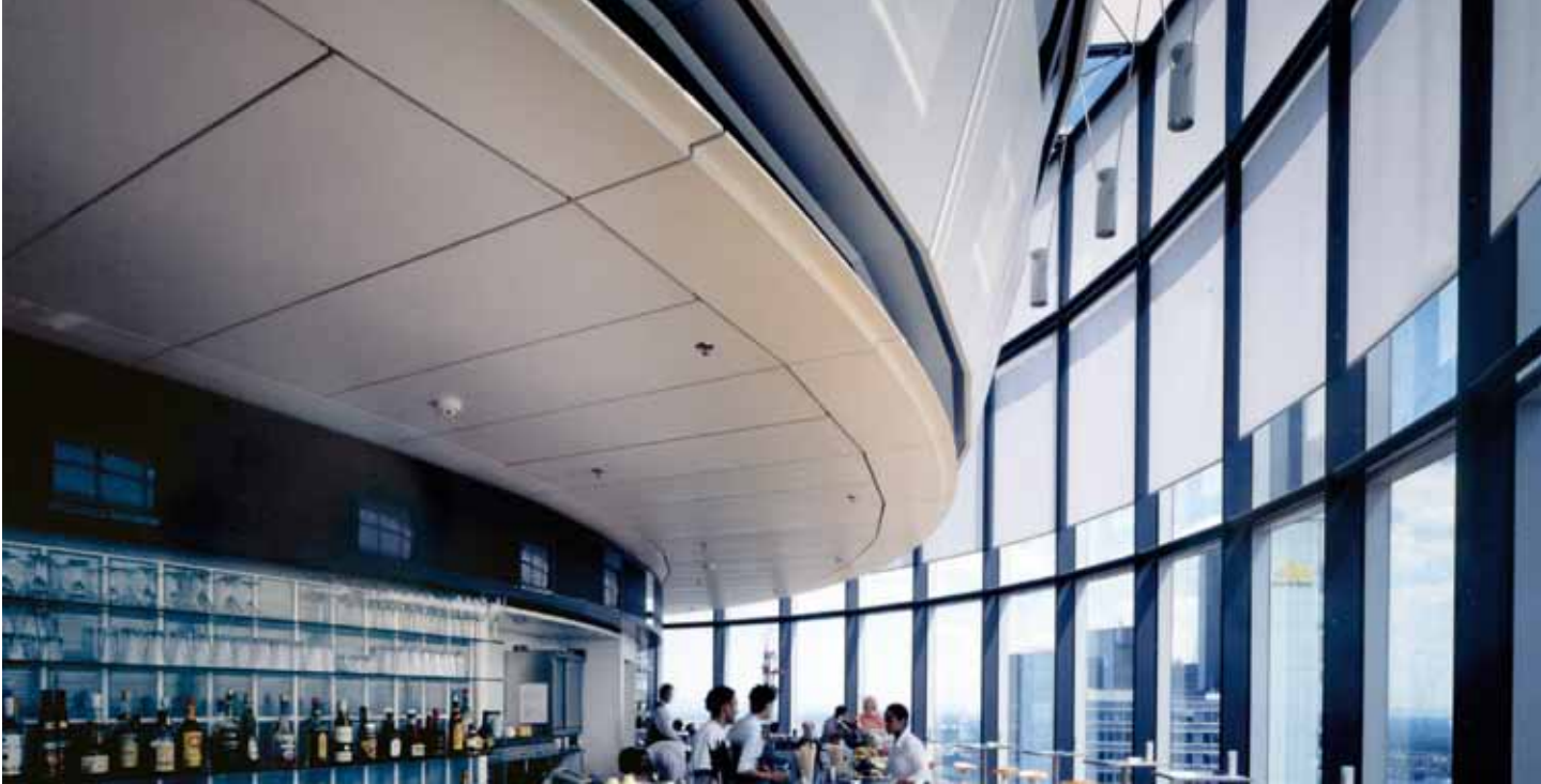
Main Tower, Frankfurt am Main