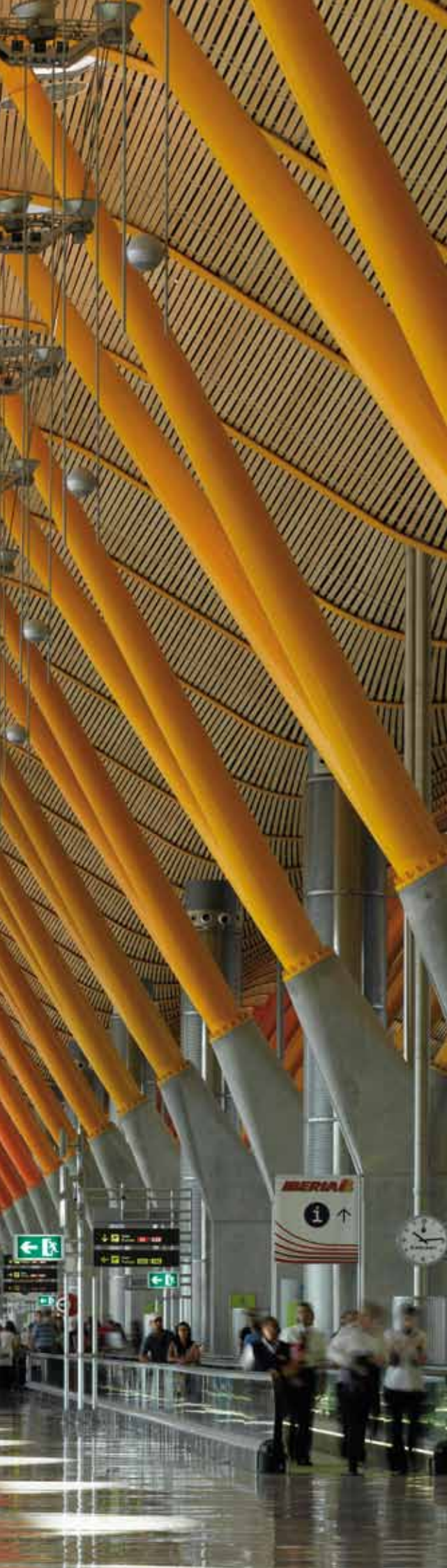
Barajas International Airport, Madrid, Spanien Architekten: Rogers Stirk Harbour + Partners, Estudio Lamela