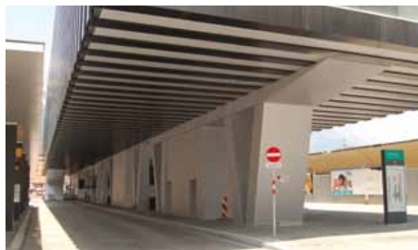
Hotel am Bahnhof, Innsbruck

Unser integriertes Projektmanagement gewährleistet eine optimale Montage Ihrer Lösungen – auch bei internationalen Großprojekten.