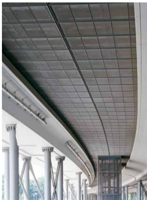
Hotel am Bahnhof, Innsbruck

Dabei umfasst unser Service die Bereiche Qualitätskontrolle, Logistik, Beschaffungs- und Lagerbereich, Finanzierungs- und Ablaufkontrolle sowie Aspekte von Sicherheits- und Gesundheitsfragen.