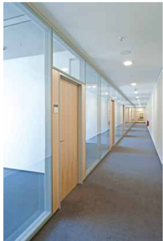
Bügelbauten, Hauptbahnhof Berlin – Glastrennwand Lindner Life 137

Bei allen Abläufen und Prozessen legen wir höchsten Wert auf umfassende Qualitätssicherung. So können wir Ihnen immer hervorragende Produkte und Leistungen bieten. Darüber hinaus zählen Arbeitssicherheit und Umweltschutz zu den wichtigsten Zielen unseres Unternehmens: Aus diesem Grund schließt unser integriertes Qualitätsmanagement automatisch alle ökologischen und Sicherheitsfragen mit ein. Unsere modernen Fertigungsanlagen sorgen für passgenaue Vorfertigung und eine lange Nutzungsdauer bei effizientem Rohstoffeinsatz und minimalem bauseitigen Abfall.