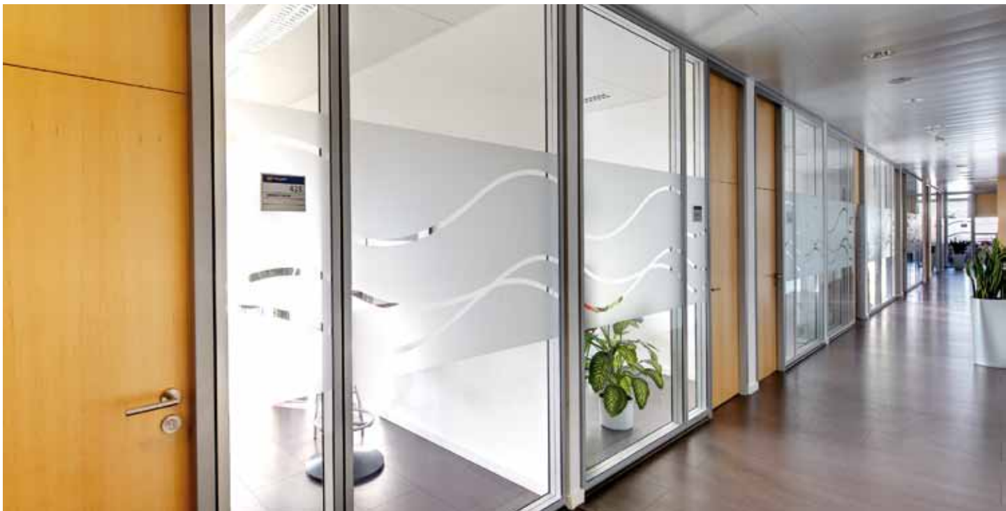
Galvaniho Business Center 4, Bratislava – Glastrennwand Lindner Life 125