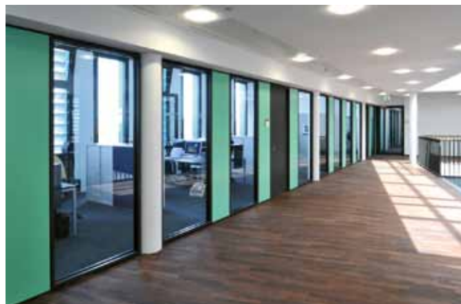
VGH Warmbüchenkamp – Glastrennwand Lindner Life 110

Sie möchten eine möglichst exklusive Wirkung erzielen? Entscheiden Sie sich einfach für Glastrennwände mit beidseitig eingehängten Aluminiumrahmen. Das Ergebnis überzeugt durch seine feingliedrige Ansichtsbreite. Sie können zwischen verschiedenen Oberflächenausführungen wählen – ganz nach Ihren Wünschen.