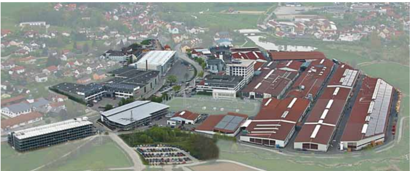
Lindner Wandsysteme fertigen wir auch an unserem Hauptsitz in Arnstorf

Alle damit verbundenen Leistungen bieten wir Ihnen aus einer Hand – einzeln oder als individuellen 360°-Betreuungskreislauf. So ermöglichen wir besonders effiziente Abläufe für die Realisierung auch ausgefallener Bauvorhaben.