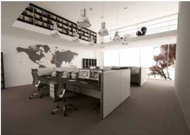
Trennwand Lindner Logic 680