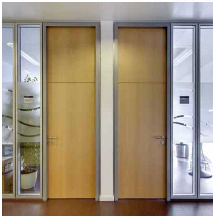
Galvaniho Business Center 4, Bratislava – Lindner Plus Aluminiumzarge

Mit unseren Zargen und Türblättern aus eigener Produktion können wir schnell und passgenau auf Ihre Bedürfnisse eingehen. Sie haben ein Spezialprojekt geplant? Darauf freuen wir uns sogar besonders: Jahrelange Erfahrung und die enge Zusammenarbeit mit allen Unternehmensbereichen ermöglichen es uns, auch ganz spezielle Wünsche zu erfüllen – zum Beispiel in Hinblick auf Brand-, Schall-, Einbruch- und Strahlenschutz.