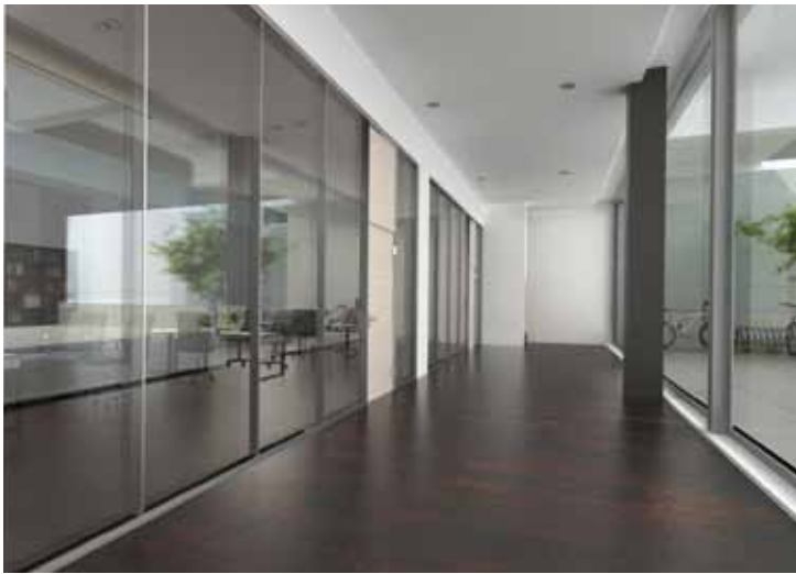
Glastrennwand Lindner Life 621