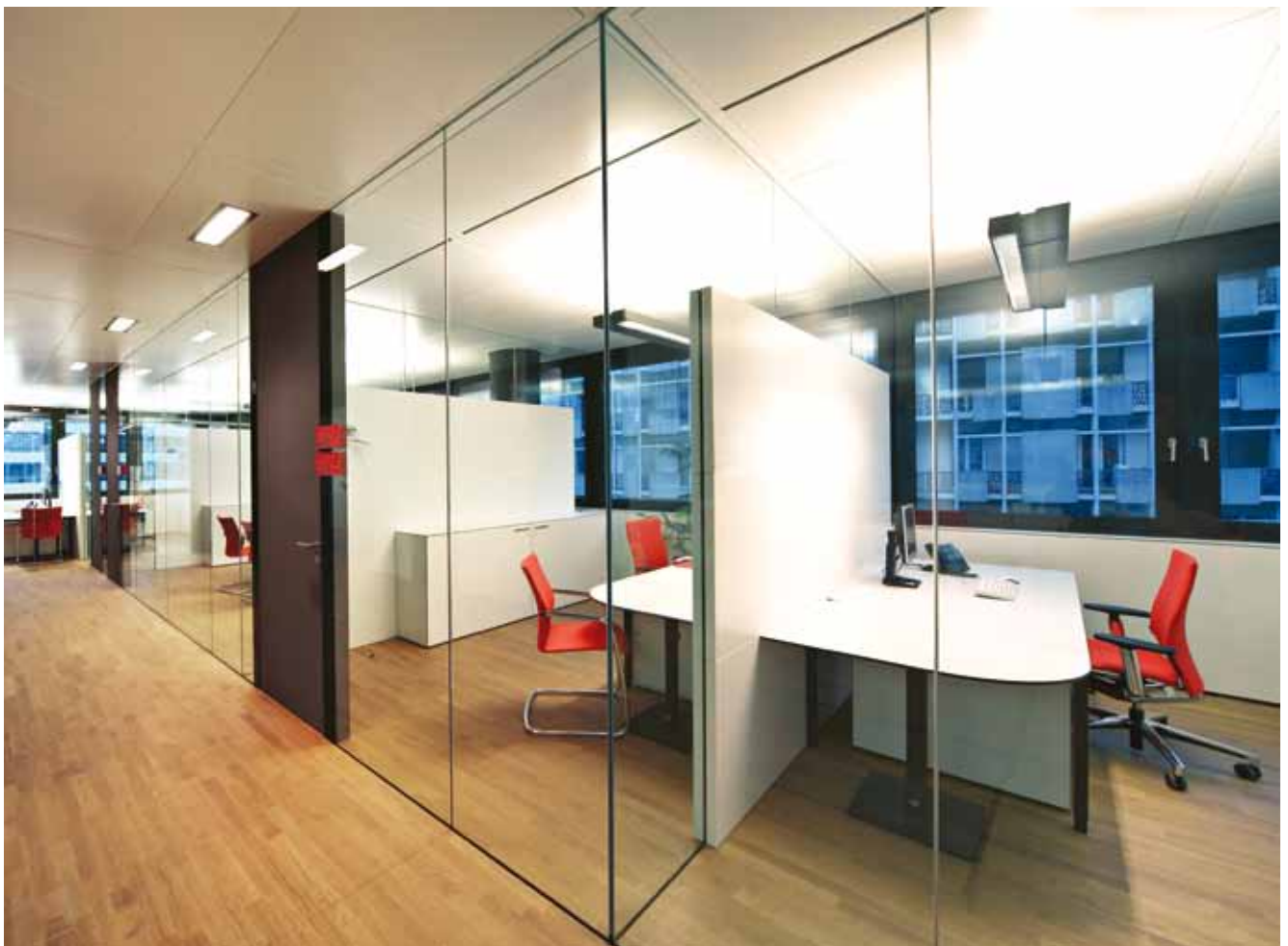
Handelskammer Bozen – Sonderkonstruktion Glastrennwand Lindner Life 620 mit vorgehängten Akustikelementen

Moderne Bürogebäude vereinen ausgereifte Funktionalität, größtmögliche Flexibilität, ein gesundes Raumklima und Energieeffizienz. Lindner Wandsysteme garantieren mit ihren vielfältigen Gestaltungs- und Kombinationsmöglichkeiten den maßgeschneiderten Einsatz in Räumen jeden Zuschnitts. Auch für die Handelskammer Bozen fanden wir die optimale Lösung: Die neu entwickelten Glastrennwände fluten den Innenraum mit Tageslicht und schaffen ein offenes kommunikatives Umfeld für alle Mitarbeiter. Gepaart mit hochwirksamen Akustikelementen entstand ein rundum stimmiges und hochwertiges Bürokonzept für die Zukunft.