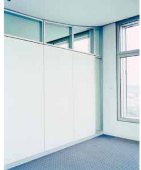
Barmenia, Wuppertal – Metalltrennwand Lindner Logic 100