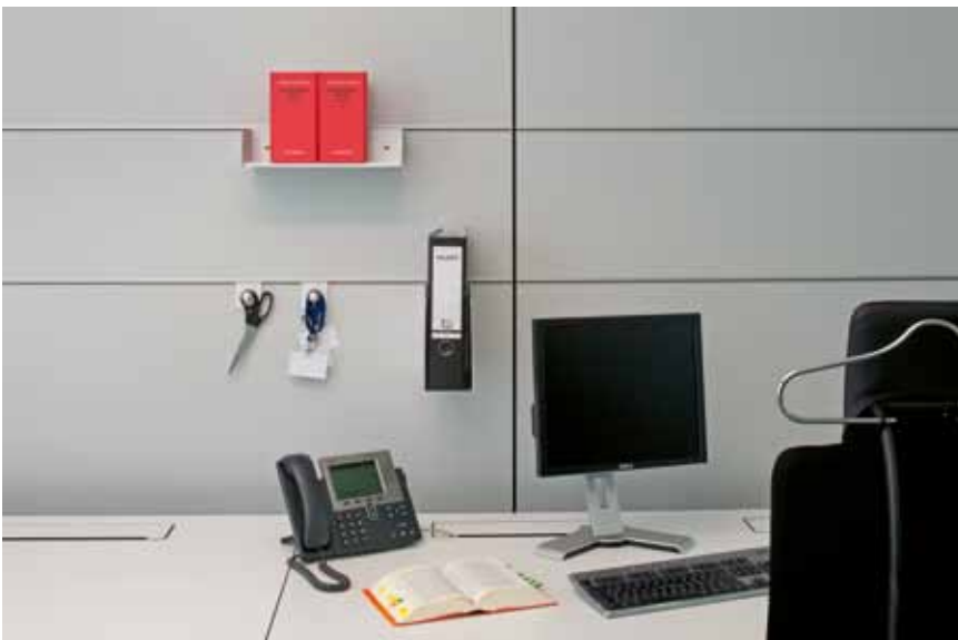
The Squaire, Frankfurt – Lindner Plus Organisation

Mit unseren Organisationselementen, Ablage- und Einhängesystemen sind Bücher, Akten und Ordner immer am richtigen Platz. Notizen und Terminpläne ebenfalls, da die meisten Elemente mit pinnfähigen Materialien ausgestattet werden können.