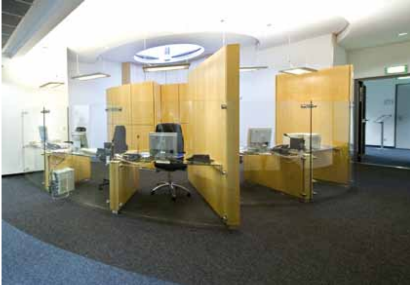
Deutschlandradio Köln – Holztrennwand Lindner Logic 100

Dank der außergewöhnlichen Vielfalt an eingesetzten Materialien und Paneelausführungen kann dabei so gut wie jedes Design verwirklicht werden. Auch auf Transparenz brauchen Sie nicht zu verzichten: Kombinieren Sie Ihre Wände einfach mit horizontal oder vertikal geteilten Verglasungen. Für mehr Raum und Ordnung sorgt die Lindner Logic zudem – mit passgenauen Regalträgern und Accessoires wird die Vollwand zum Organisationsprofi.