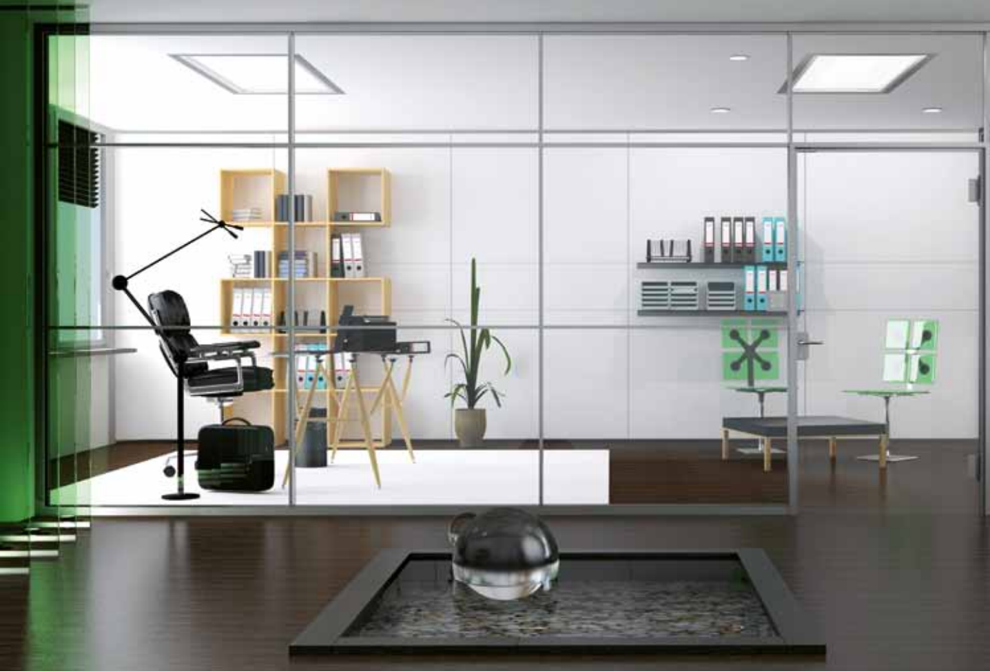
Glastrennwand Lindner Life 621