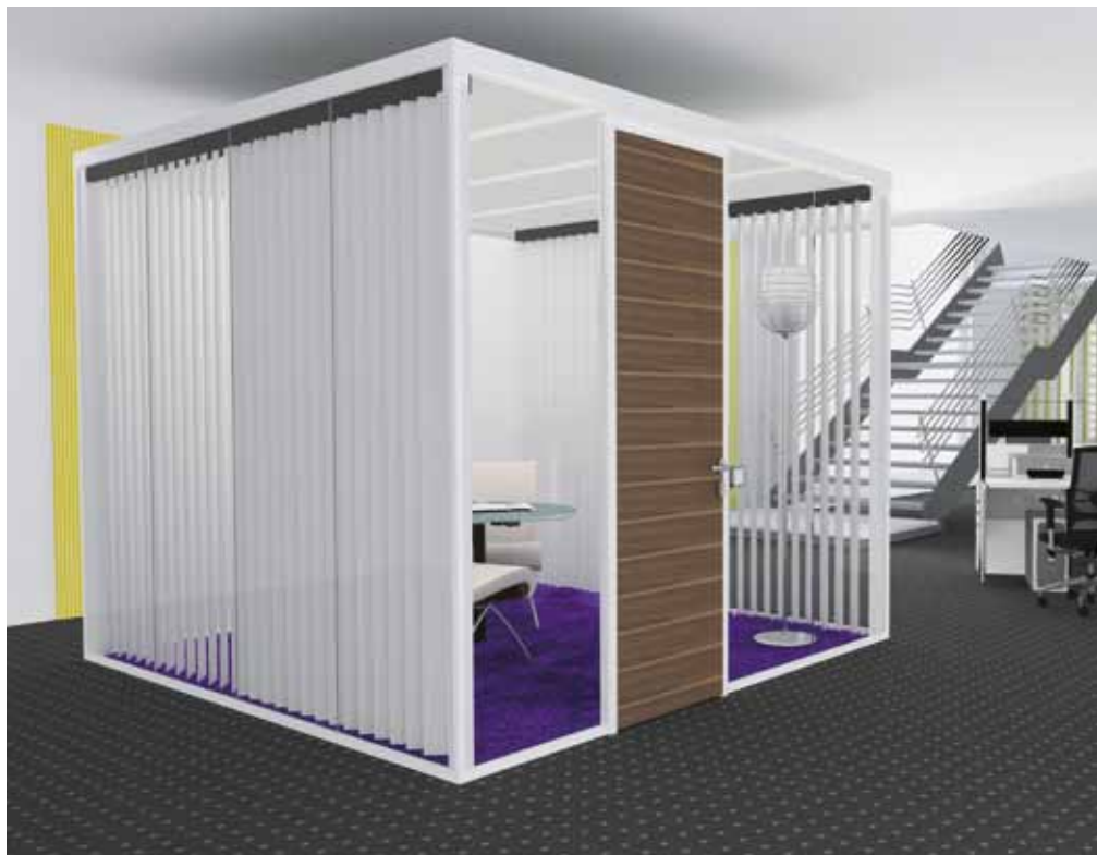
Raum-in-Raum System Lindner Cube

Lindner Cube ist der Rückzugsort, den Sie sich schon immer gewünscht haben. Und das genau an der Position, die Sie sich dafür aussuchen! Denn diese flexible Lösung benötigt keinen Anschluss an tragende Wände oder Decken: Der Lindner Cube bietet ein Höchstmaß an Anpassungsfähigkeit, da er sich vollkommen Ihren Anforderungen anpasst und nach dem Aufstellen jederzeit spielerisch im Raum versetzen lässt. Ob als Einfach- oder Doppelverglasung, als Metall- oder Holzvollwandkonstruktion – den Cube können Sie vielfältig konfigurieren und sich dadurch inmitten eines jeden Großraumbüros einen Ort der Ruhe, Konzentration und geistigen Produktivität schaffen.