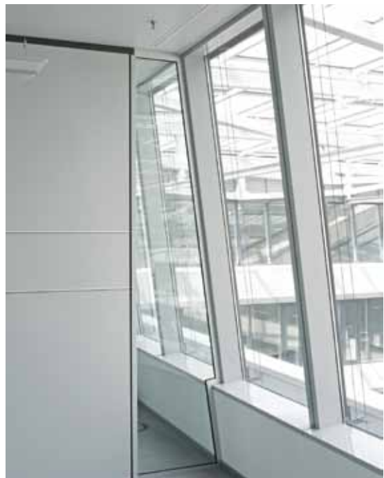
The Squire, Frankfurt – Lindner Plus Fassadenschwert

Akustikelemente ermöglichen in jedem modernen Bauwerk eine angenehme Raumakustik. Mit ihrer hohen schallabsorbierenden Wirkung ist eine geräuscharme Atmosphäre gewährleistet, für jeden das Richtige – in Größe, Perforation und Design.