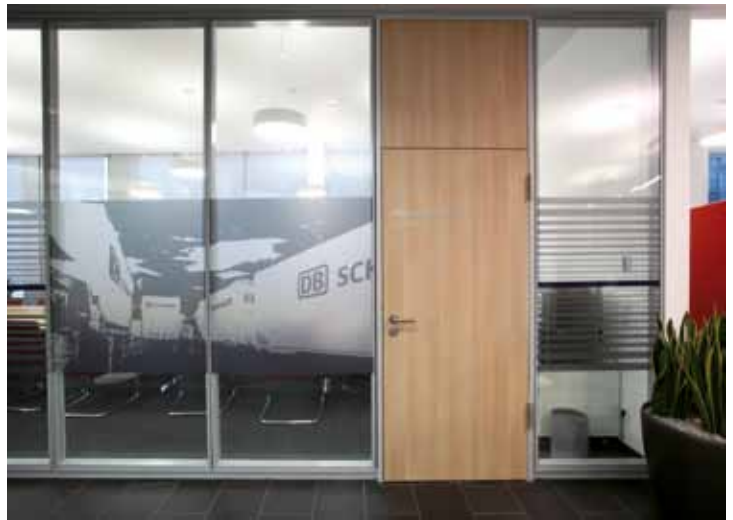
Schenker & CO AG, Wien – Glastrennwand Lindner Life 126