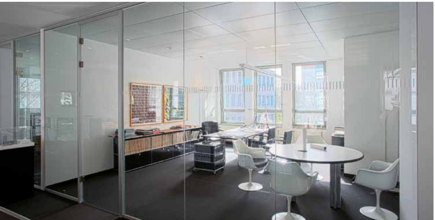
RKW Architekten, Düsseldorf – Glastrennwand Lindner Life 620