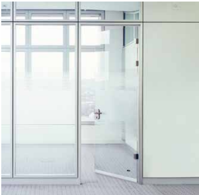
Barmenia, Wuppertal – Glastrennwand Lindner Life 125 mit Lindner Plus Ganzglastürblatt

Wie Sie Ihre Räume auch gestalten möchten: Bei uns finden Sie die passenden Zargen, beispielsweise aus Aluminium, Stahl und Holz.