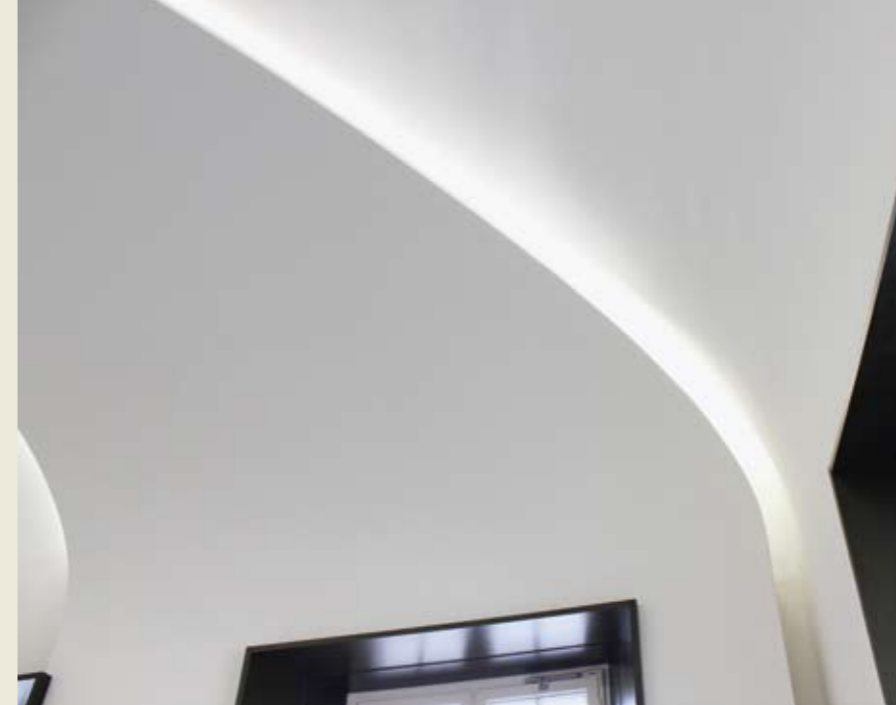
Organische Anmutung. Die indirekte Beleuchtung hinter den Deckenfeldern unterstreicht die Linienführung der einzelnen Schuppen.