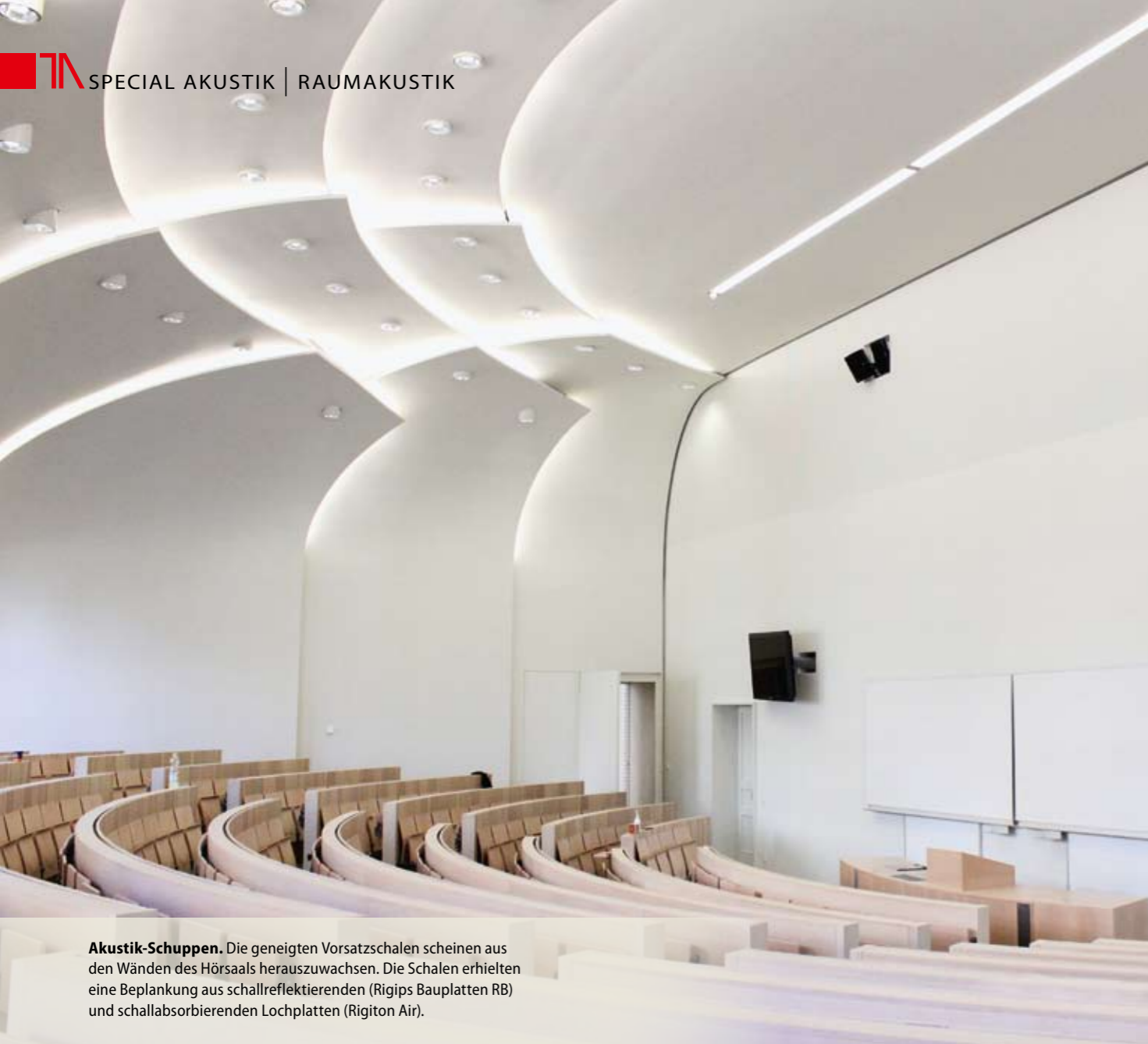
Akustik-Schuppen. Die geneigten Vorsatzschalen scheinen aus den Wänden des Hörsaals herauszuwachsen. Die Schalen erhielten eine Beplankung aus schallreflektierenden (Rigips Bauplatten RB) und schallabsorbierenden Lochplatten (Rigiton Air).